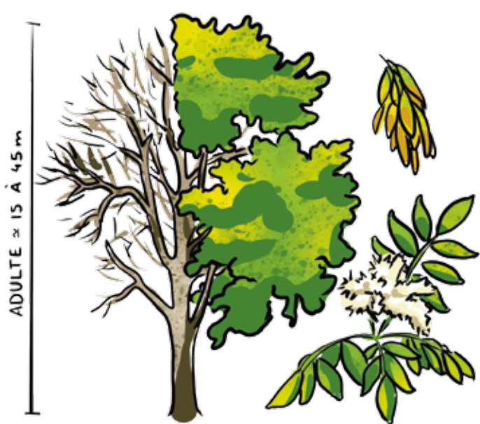
Frêne ( Fraxinus excelsior )