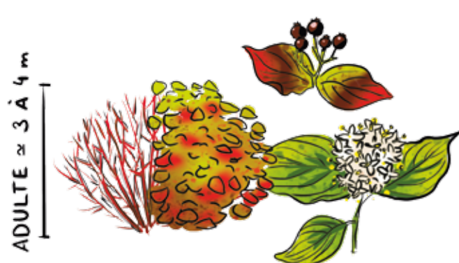
Cornouiller sanguin ( Cornus sanguinea )

Cette haie rassemble environ une vingtaine d'espèces, contribuant à la biodiversité. On peut retrouver le cornouiller sanguin, l'érable champêtre, le frêne, le merisier, l'aubépine et bien d'autres encore !