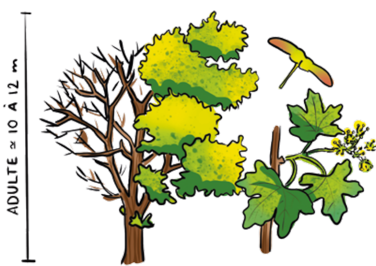
Erable champêtre ( Acer campestre )