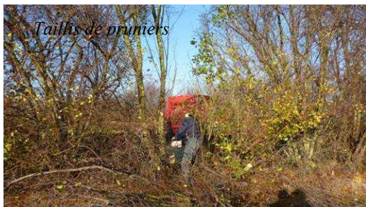
Tailhs de pruniers