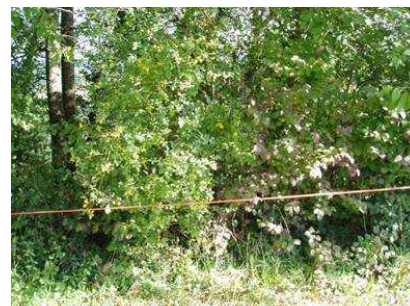
clôture du pied de haie

→ Elagage : il consiste à couper les branches au ras du tronc. Ne pas laisser de chicots qui empêchent une belle repousse et facilitent la pourriture du tronc.