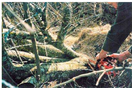
Recépage de pruniers

Les bovins « adorent » les jeunes pousses des haies (présence d'oligo-éléments différents de ceux présents dans l'herbe pâturée). Sans clôture, les haies ne se reconstitueront jamais. Leur vitalité ne tient donc qu'à un fil !!