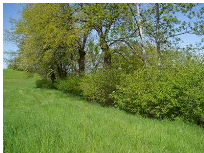
repousses de noisetiers de 2 ans