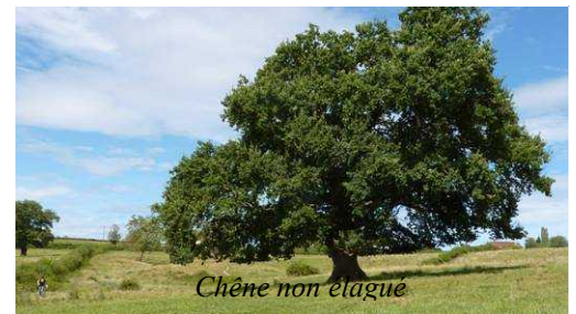
Chêne non élagué