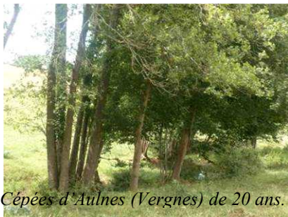
Cépées d'Aulnes (Vergnes) de 20 ans.