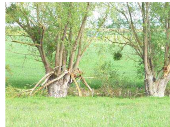
Têtard de Saule blanc : très productif