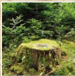
Stockage de carbone sous différentes formes