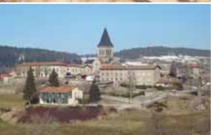
8 St Régis du coin et son réseau de chaleur au bois